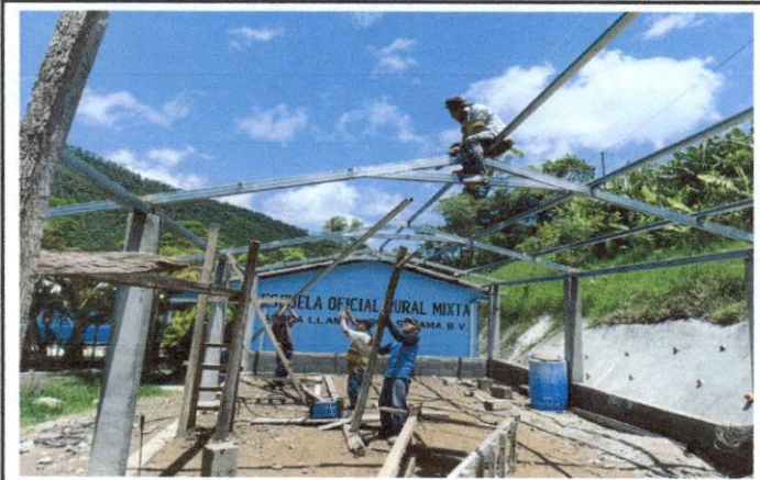
Foto 3: Mejoramiento de estructura de Portico ingreso a la Cocina